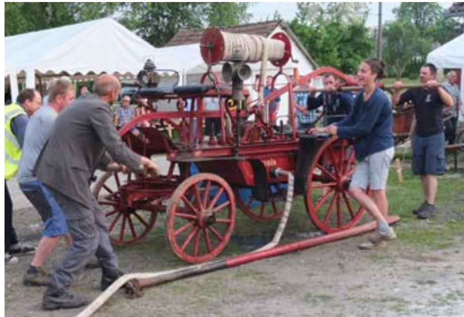
Čtyřkolová stříkačka z roku 1910

Hasiči se zúčastňovali nejen svých hasičských povinností, ale také konaných cvičení v okolí. Jako třeba 16. června v roce 1929 se jakubínští hasiči zúčastnili velkého okrskového cvičení ve Ctiboři za účasti sborů Rymbereka (Polesí), Veselé, Lískovce, Bělé, Častrova a Ctiboře. Téhož dne bylo uspořádáno i školení jednatelů a po skončení cvičení se konala v hostinci u Doležalů hasičská zábava. V roce 1935 vznikl velký požár v Jakubíně u pana Svobody a pana Dvořáka, kde ale bohužel i za pomoci okolních ha-