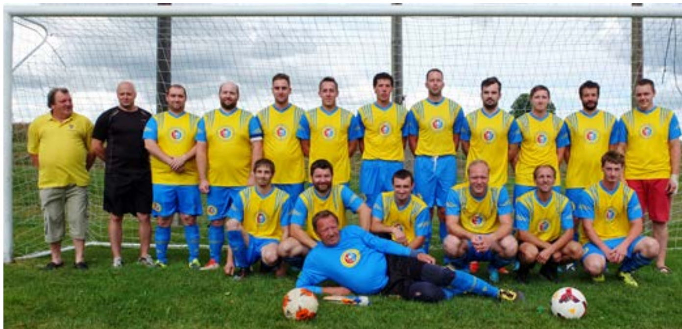
Naši fotbalisté představili nové dresy