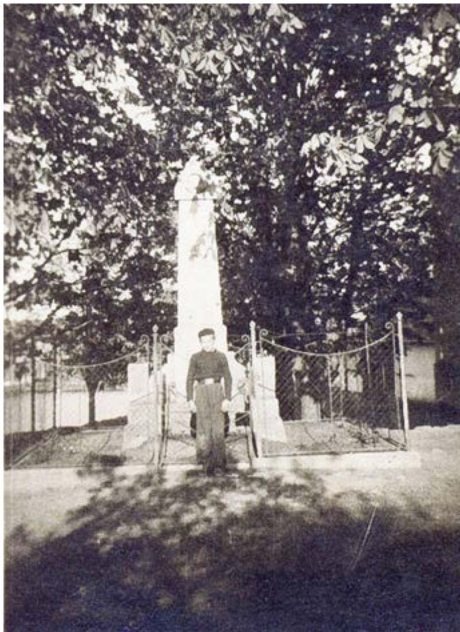
Původní podoba pomníku