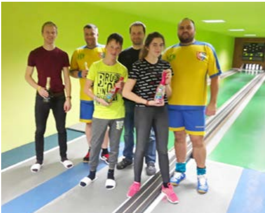
Vítězové jednotlivých kategorií s předsedou oddílu a hlavním rozhodčím turnaje.